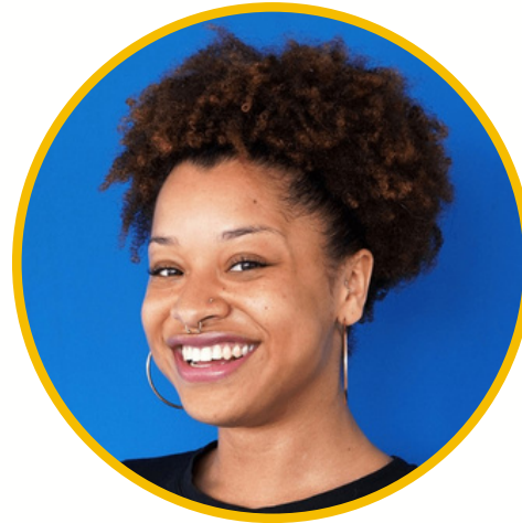
Jamaïca Ingénieure technique*